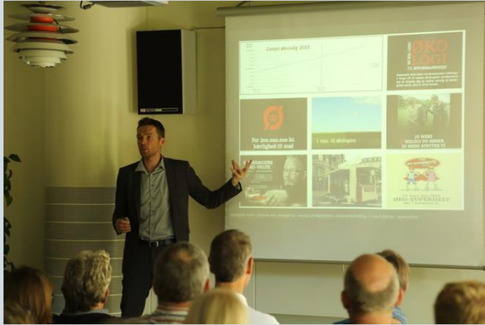
Farmer visit COOP DKK