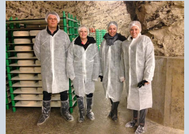
COOP visiting our lime stone cave